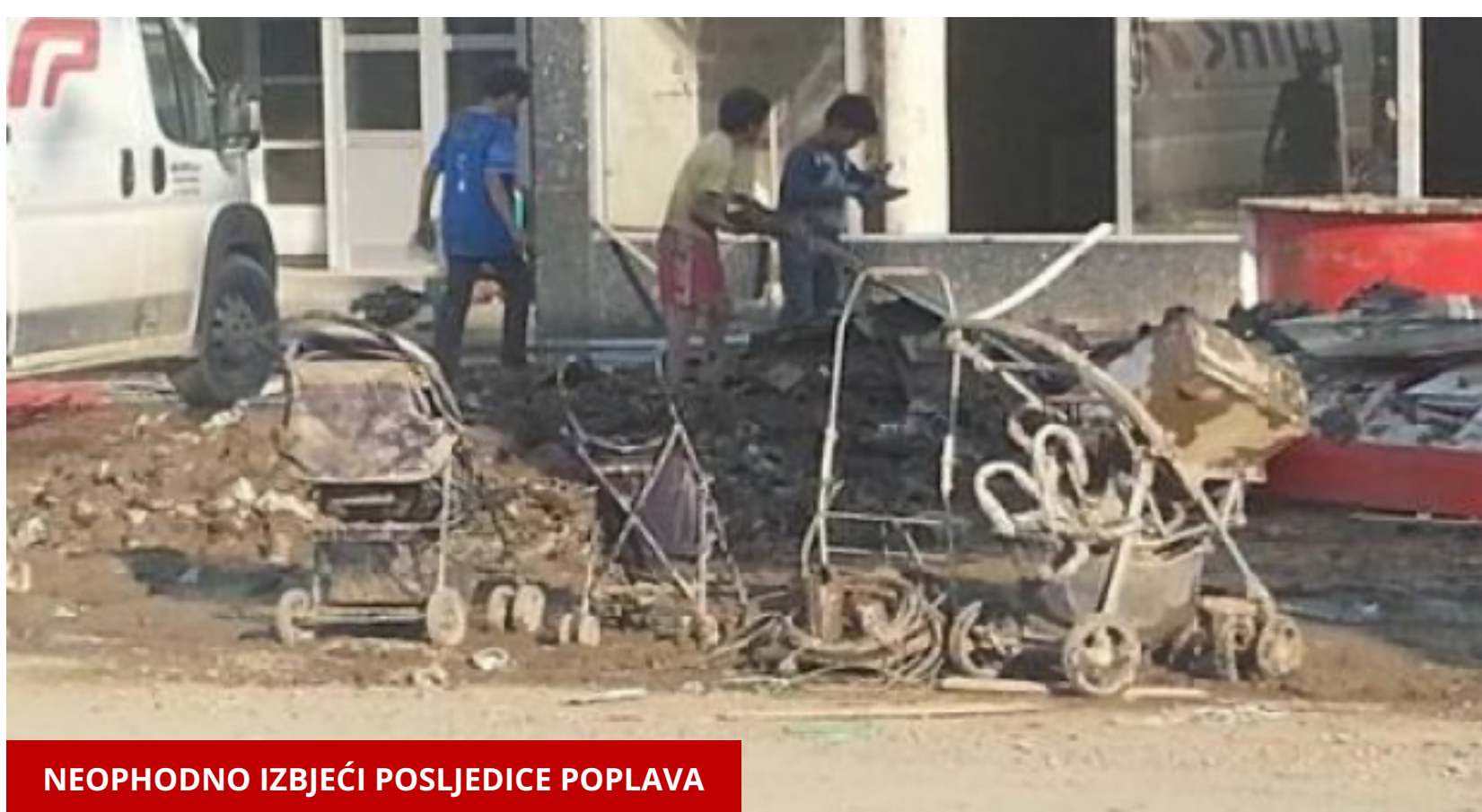
NEOPHODNO IZBJEĆI POSLJEDICE POPLAVA

U prvih osam mjeseci najviše noćenja ostvarili