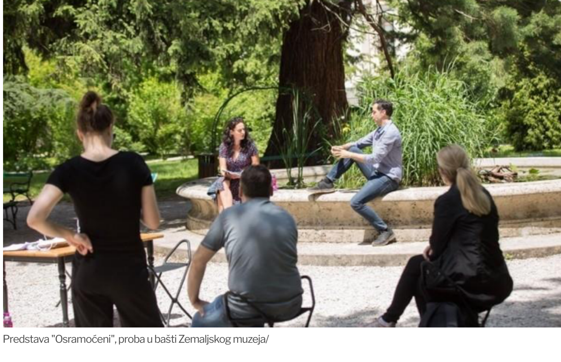
Predstava "Osramoćeni", proba u bašti Zemaljskog muzeja

- Priroda nas uslovljava. Niko to ne zna i ne može kao ona. Vjetar, kiša, hladnoća, vrućina su izazovi, ali nemaju ljutnje. Mi se prilagođavamo i izazovi su nam lekcije koje treba naučiti ili obnoviti, podsjetiti se na to da li smo još vitalni, spontani i prilagodljivi kada izademo iz komfora.