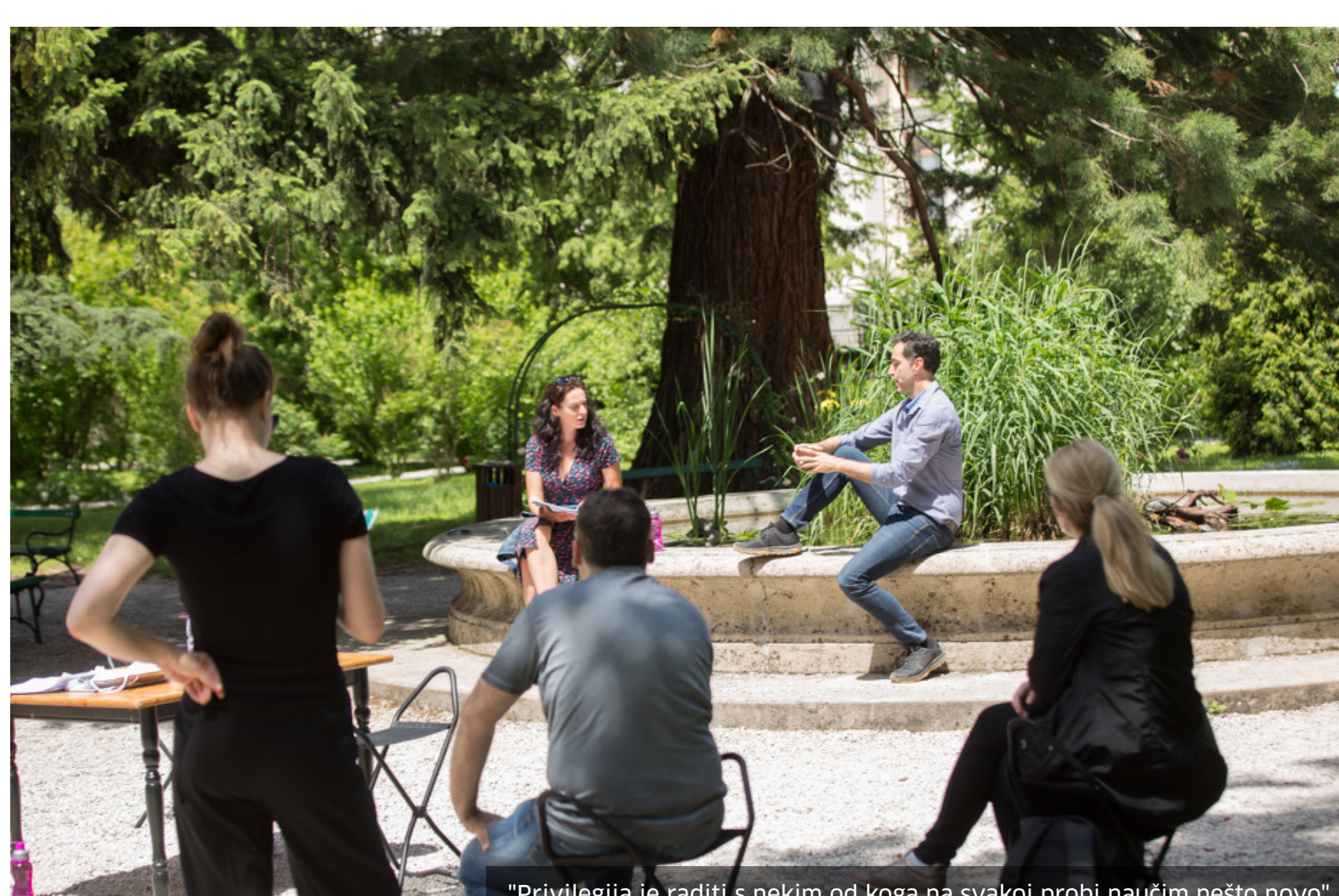
"Privilegija je raditi s nekim od koga na svakoj probi naučim nešto novo"

Jako volim tu ulogu, kao i predstavu u cjelini. Paolo Magelli je izuzetan reditelj koji nas je sve zaljubio u materijal, svi predstavu igramo posvećeno i strasno. Rijetka je privilegija igrati Brechta, pogotovo takav klasik. Ta antiratna krvava bajka u Sarajevu posebno rezonira. Najdraža mi je uloga uvijek ona koju trenutno radim.