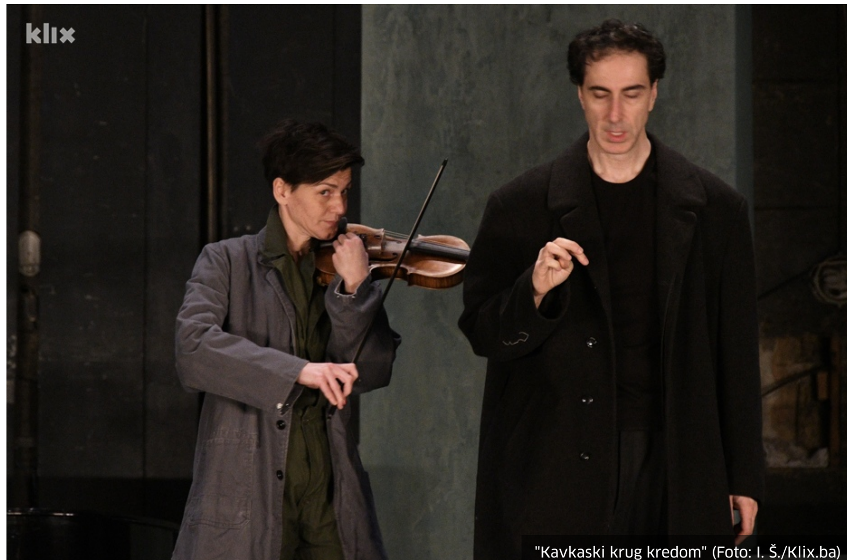
"Kavkaski krug kredom"

To je bila prilika da se podsjetimo nekih predstava koje nisu više na repertoaru. To je neuporedivo za živim kontaktom. Situacija sa pandemijom nam je samo potvrdila koliko je organska naša potreba za komunikacijom, živom razmjenom, nadahnućem. Ne brite za sudbinu pozorišta, starije je od svih drugih duhovnih praksi, preživjelo je sve civilizacijske ekstreme, preživjet će i pandemiju.