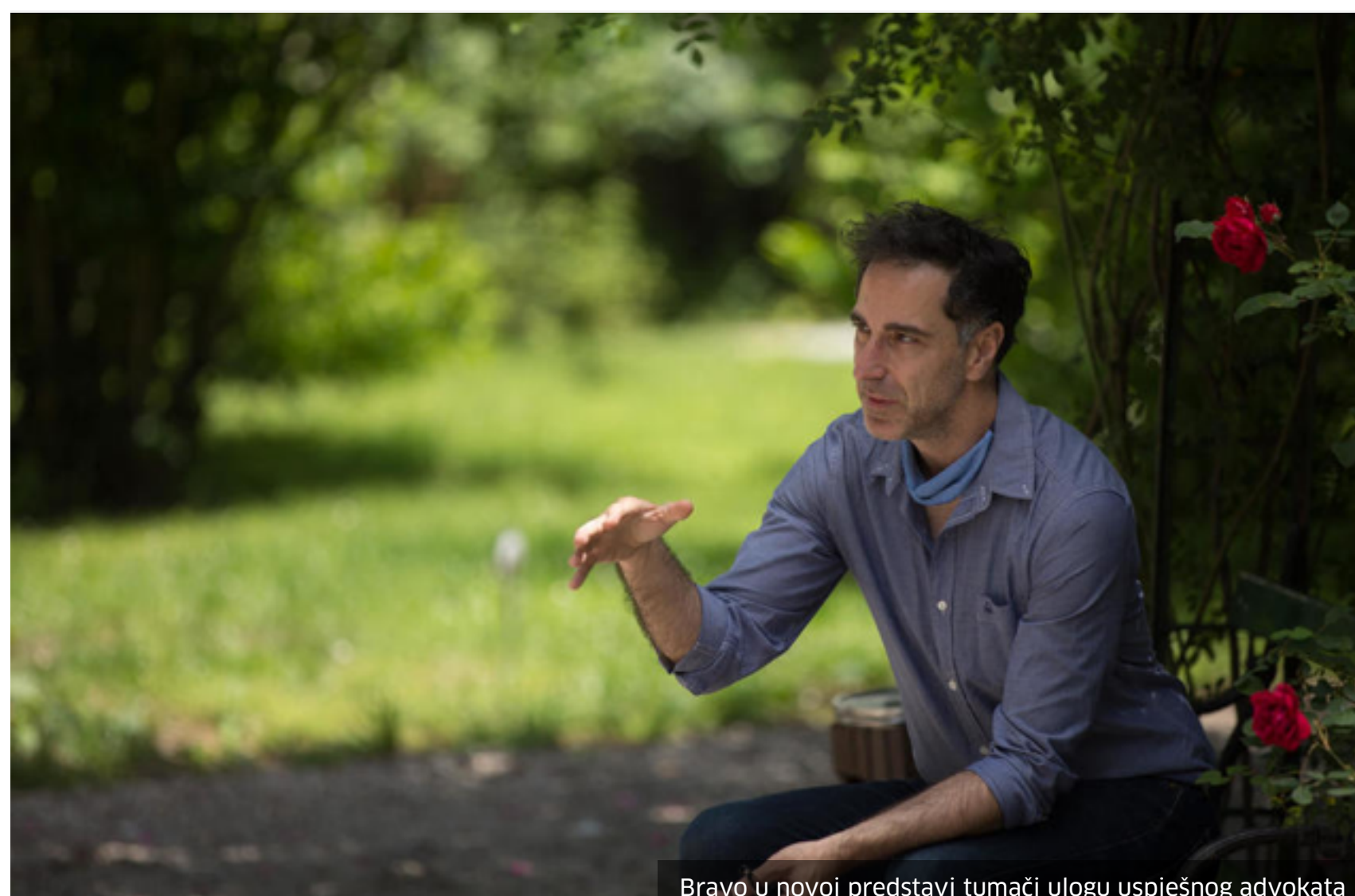
Bravo u novoj predstavi tumači ulogu uspješnog advokata

Udruženje Kontakt polako privodi kraju pripreme predstave "Osramoćeni" u kojoj jednu od glavnih uloga tumači i uspješni bh. glumac i reditelj Ermin Bravo. U razgovoru za Klix.ba Bravo komentariše vezu politike i kulture, svoju karijeru te otkriva očekivanja od mladih nada koje sve sigurnije koračaju putevima bh. glumišta.