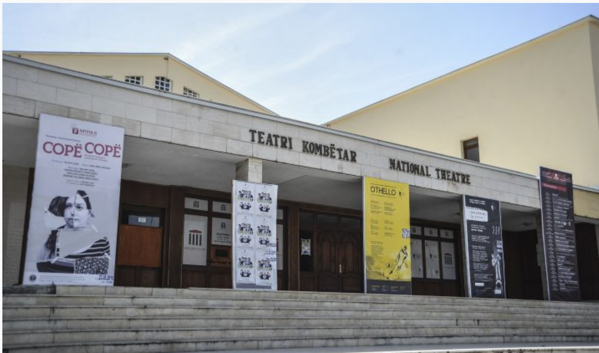
Teatri Kombëtar i Kosovës