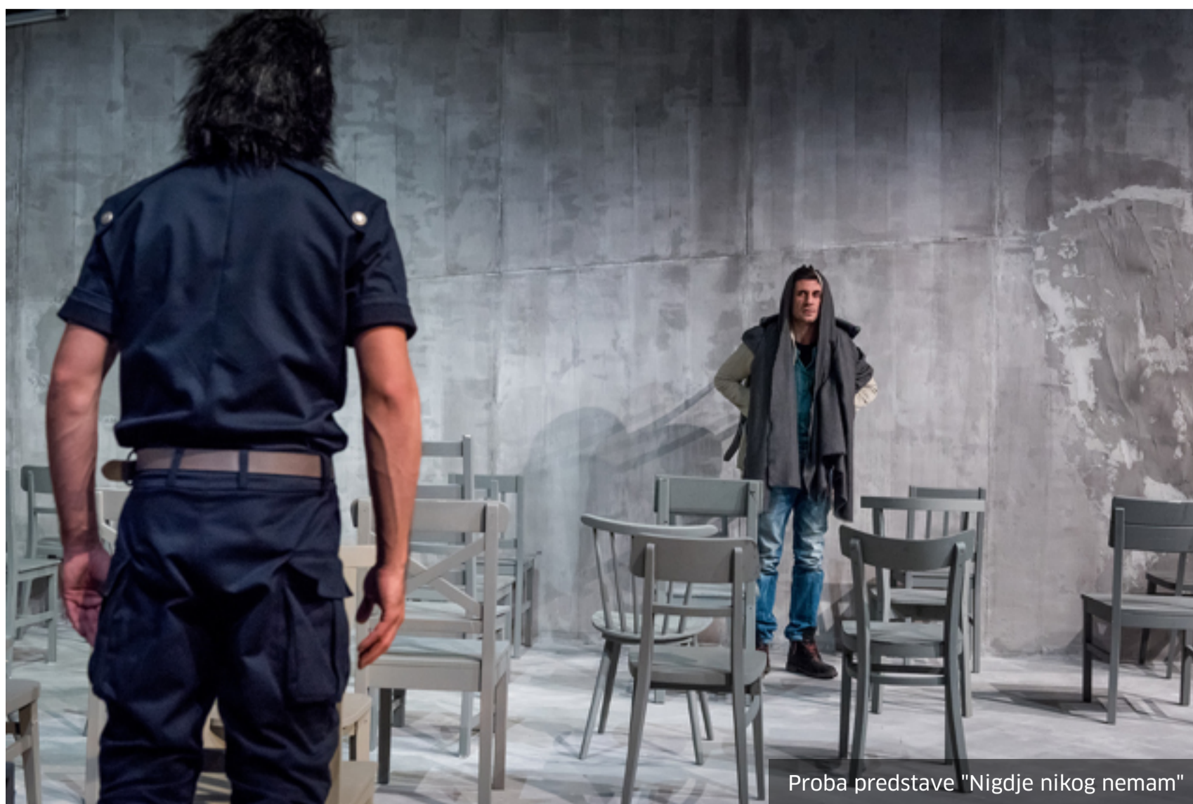
Proba predstave "Nigdje nikog nemam"

"Mi veoma dobro znamo šta je represivan režim. Ja sam se lično formirao u njemu, proveo djetinjstvo i adolescenciju u njemu. Nama se historija prečesto ponavlja. Živimo u euforičnoj želji da komšiji crkne krava. Mi stvaramo represivne sisteme. U Ibsenovoj drami 'Neprijatelj naroda' ima jedna replika gdje glavni junak dr. Stokman kaže 'Ah, ta prokleta kompaktna većina'. Taj komad je napisan prije 140 godina, a ta replika je uvijek bila kontroverzna. Mi imamo tu kompaktnu većinu koja uglavnom bira mediokritete na izborima. Dakle, itekako se možemo poistovjetiti s Bondovim svijetom", rekao je.